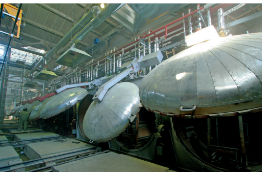
Автоклавное отделение, общий вид паровой обвязки технологических паропроводов линии по производству изделий из ячеистого бетона

годового выпуска свыше 360 тыс. м 3 , сухих смесей — в объеме до 38 тыс. тонн в год.