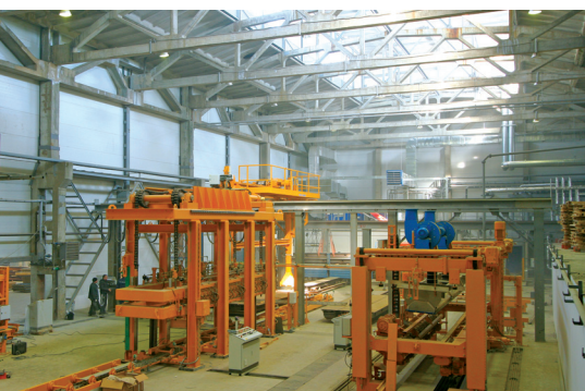
Линия резки и делительная машина технологической линии по производству изделий из ячеистого бетона