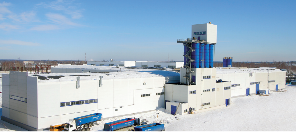
Производственные площадки Волжского завода строительных материалов