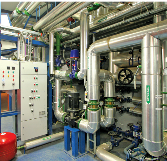
Блочно-модульная паровая котельная мощностью 20 МВт финской компании «КПА Уникон»